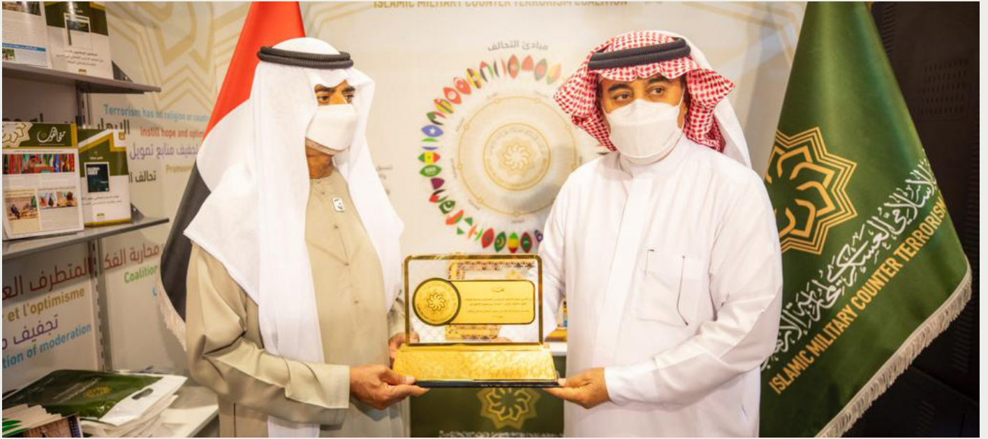
معالي الشيخ/ نهيان بن مبارك آل نهيان وزير التسامح والتعايش بدولة الإمارات العربية المتحدة في زيارة جناح التحالف